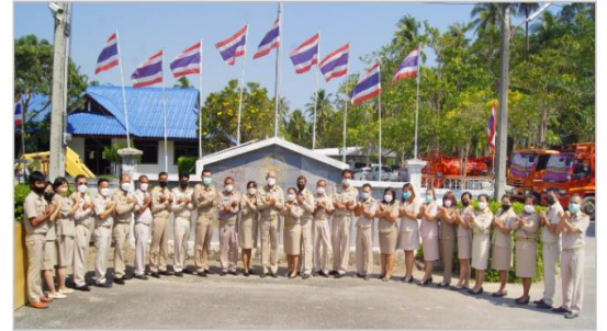
กลับไปรับสำเนาเจตจำนงสุจริตของอยู่ บริหาร